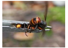
コガタスズメバチ