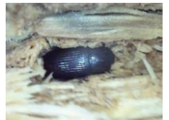
ゴミムシダマシの一種