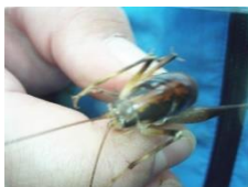
カマドウマの一種