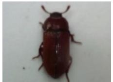
ゴミムシダマシの一種