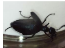
ツチハンミョウの一種