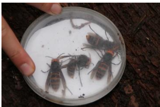
コガタスズメバチの女王 4匹