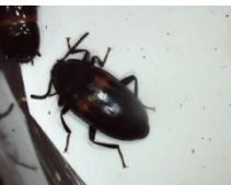
キノコムシの一種