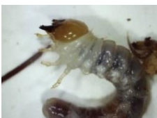
スジクワガタの幼虫