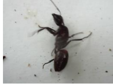
ムネアカオオアリ