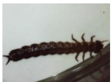
ベニヒラタムシの幼虫