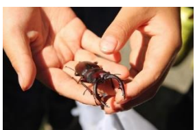
ノコギリクワガタ