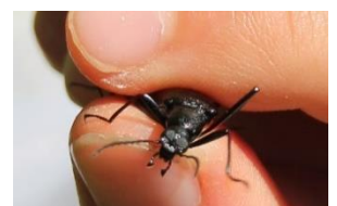
クロナガキマワリ