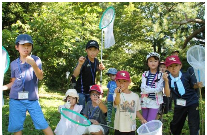
あまったクワガタのじゃんけん大会と勝者