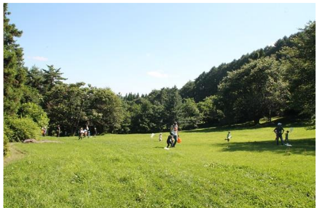
わんぱく広場での採集風景