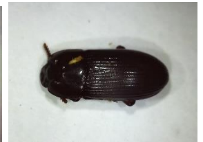
ゴミムシダマシの一種