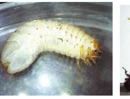
コガネムシの幼虫