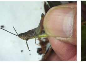
ヒロバナヒナバッタ