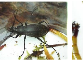
クロナガオサムシ