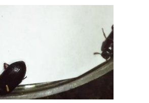
ゴミムシダマシの一種