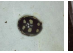
テントウムシの一種