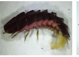
ホタルの一種の幼虫