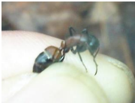
ムネアカオオアリ