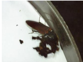
カバイロコメツキ